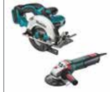
Diamantscheiben- / Winkelschleifer Kreissäge