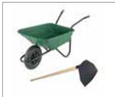
Schubkarre / Hacke (Mörtelzubereitung)