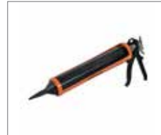
Auftragspistole zum Einbau des Fugenmörtels