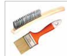
Metallpinsel / Pinsel