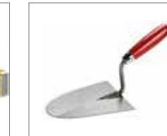
Rundkelle zum Verteilen von Mörtel