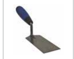
Quadratische Kelle zum Verteilen des Klebers