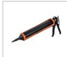
Application gun for joint mortar installation