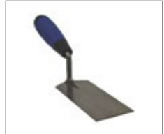
Square shaped trowel for glue spreading