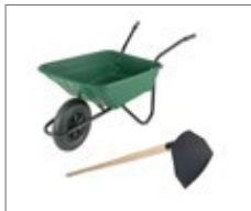
Wheelbarrow / Hoe (mortar preparation)