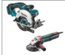
Circular cutting saw with diamond disc / angle grinder