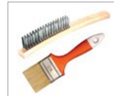
Wire brush / Paint brush