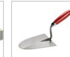
Round shaped trowel for mortar spreading